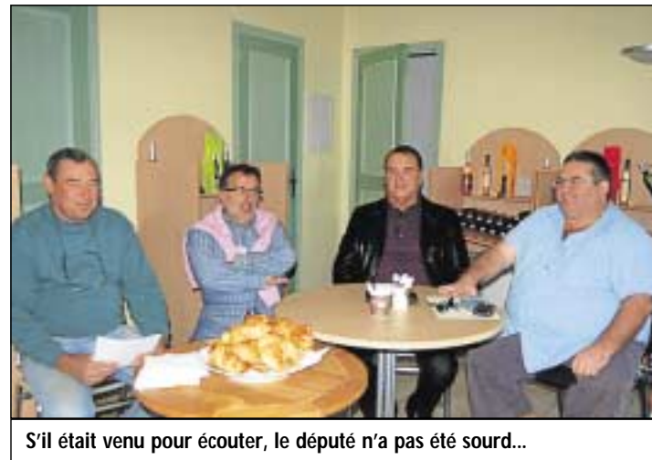
S'il était venu pour écouter, le député n'a pas été sourd...