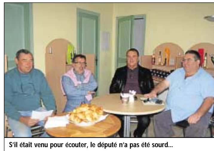
S'il était venu pour écouter, le député n'a pas été sourd...